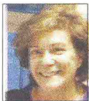
di EVA DESIDERIO

Da domani a lunedì in Fiera l'edizione numero 49